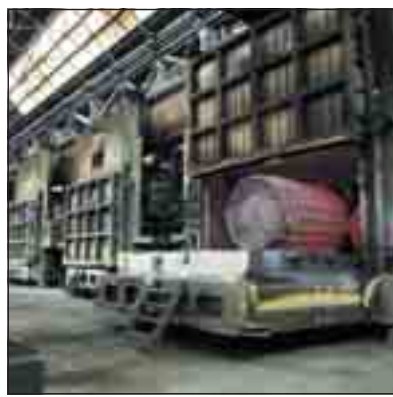
L'interno di uno stabilimento Lucchini